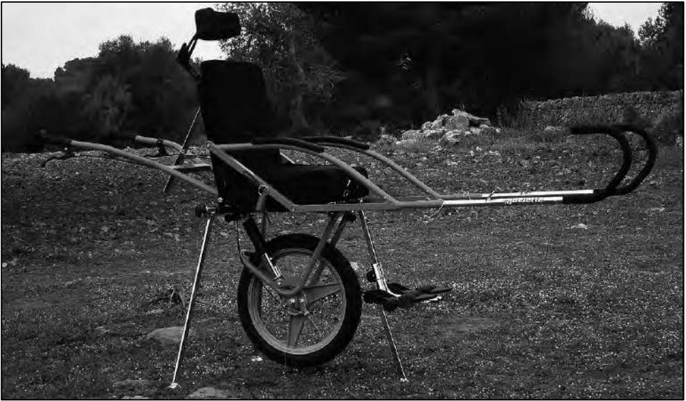
Una vez montada, conviene revisar si también llevamos todo lo necesario.

No puede faltar un kit básico con las llaves de tuerca necesarias, un pequeño spray de aceite lubricante, unas bridas, cinta americana, desmontables, parches y disolución o spray antipinchazos y una pequeña y ligera bomba de inflado. Tampoco estarán de más una reposición de tuercas y pasadores por si se perdiese alguna o se nos olviden al desmontar.