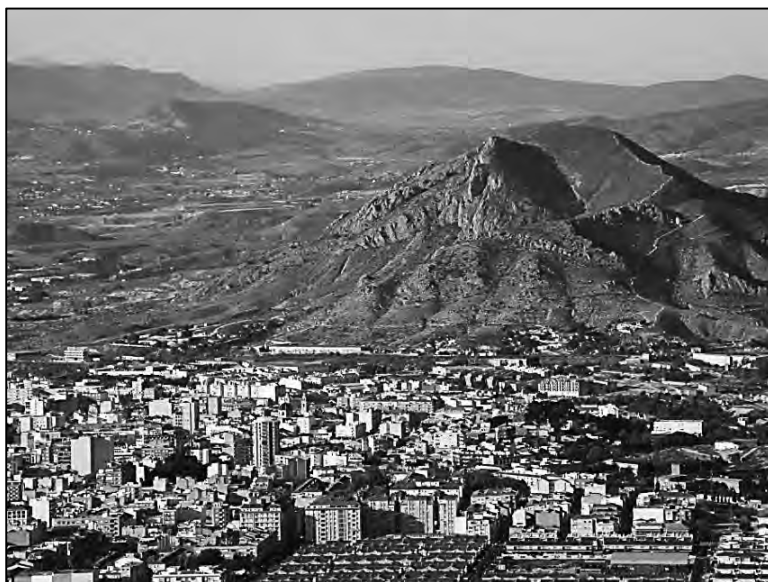
El monte de Bolón, pegado a la ciudad de Elda.

Años después escribí un cuento infantil que narra los detalles de tal fábula, al que titulé “El bosque de la Bola, la Leyenda de Bolón” , sin imaginar que aquellos textos llegarían a arraigar todavía más, entre los niños, aquella historia que unos veteranos montañeros habían iniciado, tiempo atrás, igualmente sin proponérselo.