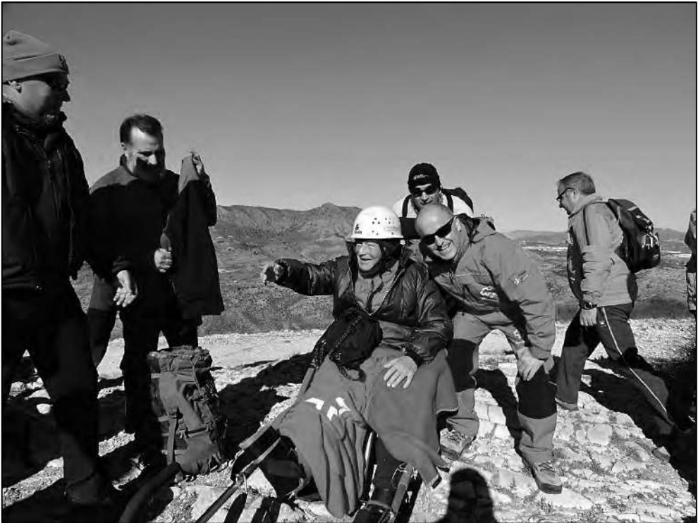
El frío en la cumbre de Bolón se combatió con mayor abrigo.

Las insensibilidades en los miembros han de ser siempre tenidas en cuenta, especialmente en los inferiores, siempre hay que extremar las precauciones con las piernas y los pies del pasajero ya que se encuentran en una posición vulnerable a golpes con piedras o raspones con vegetación u otros accidentes del terreno que en el caso de ausencia de sensibilidad en esas extremidades, un golpe puede producir una lesión o un daño del que el pasajero no nos podría avisar al no darse cuenta y que se puede agravar si no se atiende con prontitud, es importante tener esa zona controlada, para ello uno de los pilotos auxiliares, el que iría de descanso esperando aportar un relevo, estará pendiente del desplazamiento de la silla advirtiéndolo a los guías de los resaltes que puedan suponer un peligro para solventarlos con mayor cuidado y sobre todo verificar en todo momento la ausencia de lesiones.