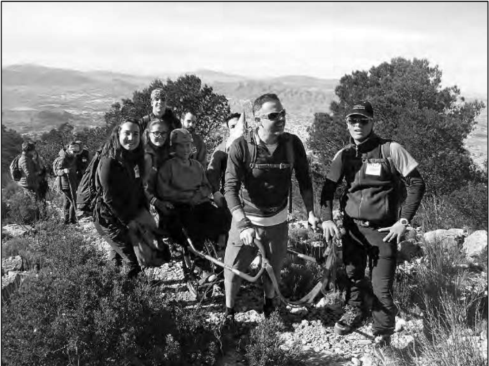
Durante las II Jornadas de Montañismo Inclusivo de Cuentamontes en la Silla del Cid

Básicamente la técnica de guiado está enfocada a que el peso de la silla recaiga durante la marcha en la rueda de forma vertical, teniendo en cuenta que la posición de la espalda del pasajero se encuentre en posición vertical fundamentalmente y evitando esfuerzos extraordinarios de estabilización por inclinaciones laterales, ello viene dado en función de la tonicidad muscular en el tronco del pasajero para lo que nos pueden ayudar unos arneses complementarios para que la espalda y la cabeza del pasajero, si así lo requiere, se encuentren lo más fijos posible a la silla, prestando atención a la posición vertical de la espalda, evitando que se vaya hacia adelante o hacia atrás en función a las inclinaciones que presente el terreno, para ello ayuda la gestión de la altura del manillar trasero que hay que regular constantemente en función a la inclinación del terreno y de la coordinación de los guías.