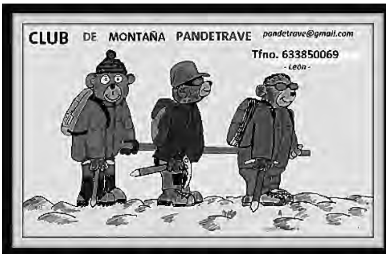
Logotipo del grupo.

Siguiendo la estela del escaso conocimiento que, de estas materias atesoro, he de regresar al día en el que descubrí que había un Club de montañismo cuya principal actividad, o al menos eso entendí, residía en atender a todos estos amigos que, como en mi caso, habían quedado OLVIDADOS en el contexto de la sociedad montañera. Me refiero al Grupo de Montaña PANDETRAVE.