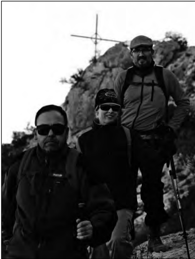
Regresando de la cruz.

Con una mezcla de satisfacción y ganas de más, llegamos al lugar de partida, donde de nuevo se repartieron abrazos, alegrías y agradecimientos mutuos. Ahora sí, podíamos decir que la expedición había sido un éxito. Ya terminada la actividad, regresaba a casa con los conceptos, que a primera hora eran erróneos, transformados para bien, y es que aquella mañana no subimos a nadie a la cima de Bolón, porque nadie sube a nadie, sino que cada uno sube empujando en la medida de sus posibilidades con los pies, con la cabeza o con el alma, y tampoco nadie en especial fue beneficiario o beneficiaria de esta actividad inclusiva, sino que todas las personas que participamos de aquello, recibimos una gran lección y un gran regalo. Ahora pues, sólo queda fijar un nuevo objetivo e ir a por él con decisión, porque de eso trata la vida, de superar obstáculos, de romper barreras y de fijarse metas continuamente.