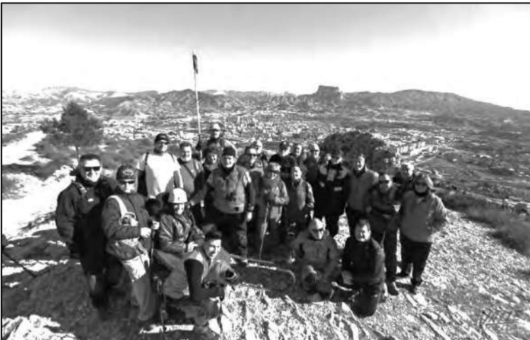
La cumbre nos iguala y nos hace a todos mejores.

Concluyo con todo ello que no hay que perderse en querer saber si lo que se siente es altruismo o placer por sentirse útil pues, lo más importante es tomar la firme decisión de querer vivir la experiencia, convencido como también ahora yo lo estoy, de que vale la pena pues, más allá de la curiosidad por conocer o aprender, es posible que descubras impensables compañeros que van a enriquecer el concepto que ahora tengas de otras clases de diversidad funcional, distintas a las propias que todos tenemos.