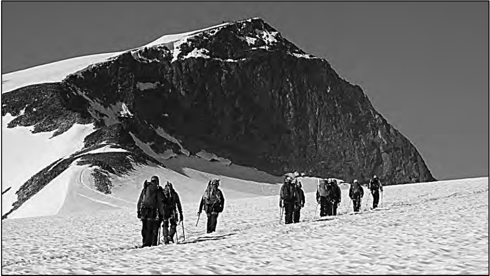
La cumbre del Glittertind, en Noruega.

ción militar del GMAN (Grupo Militar de Alta Montaña) y como, no podía ser menos por antigüedad y trayectoria excursionista y montañera, el Centro Excursionista de Catalunya con su sección de deporte adaptado.