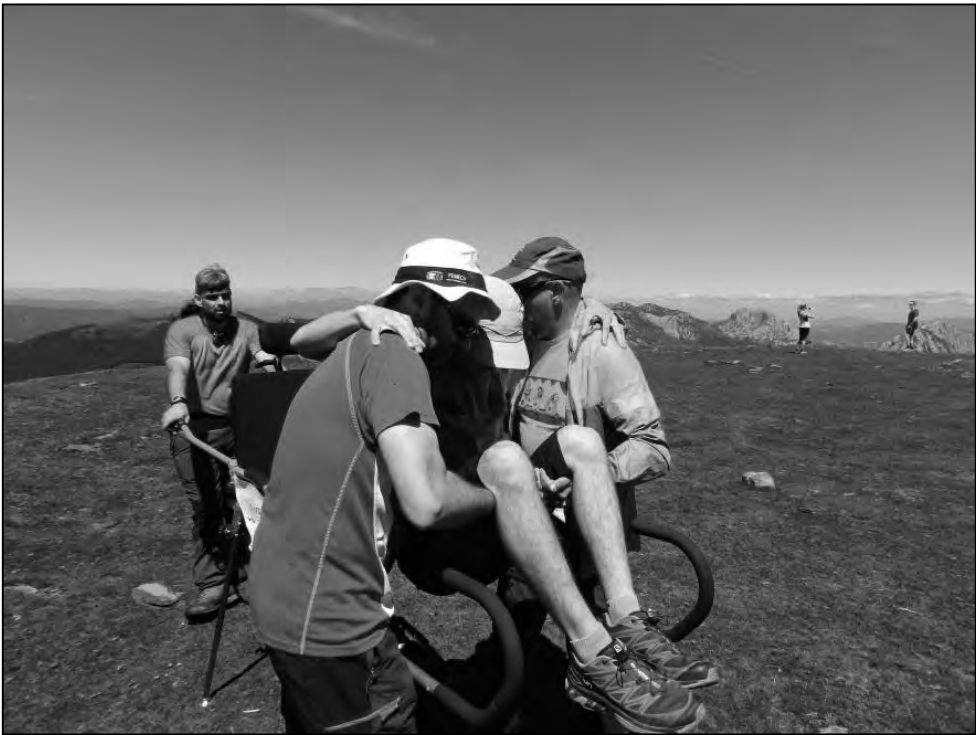
Transferencia del pasajero de la Joëlette.

En caso de temperaturas elevadas también debemos anticiparnos a las necesidades del pasajero por los mismos motivos, debiendo ser precavidos también a la hora de atender una óptima hidratación del pasajero en todo momento, no debemos esperar a que nos pida un alto para beber y colocar un pañuelo o gorra bajo el casco, así como aplicar protector solar en las partes del cuerpo expuestas de forma directa al sol. El sudor también podría facilitar la aparición de rozaduras en las partes en contacto con la silla. Es en las paradas para descansar o hidratarse cuando debemos bajar al pasajero y cerciorarnos de que esas rozaduras no se están produciendo.