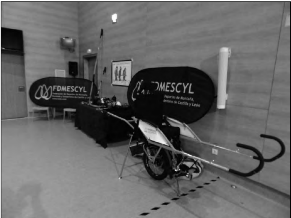
Exposición de senderismo inclusivo. Centro de Referencia Estatal en Discapacidad, San Andrés del Rabanedo

Precisamente esta asociación francesa influyó directamente en la primera actividad con joëlettes llevada a cabo en nuestro país. Fue en mayo de 2006, la Asociación Vallés Amigos de la Neurología (AVAN) consiguió subir a la cima de La Mola, en el parque de Sant Llorenç del Munt (Vallés Occidental), con tres joëlèttes integradas en el equipo de más de 80 voluntarios que formaban parte de aquel grupo, consiguiendo así poner en marcha la primera actividad de senderismo inclusivo utilizando estas sillas, todo ello aleccionado por los franceses de Handi-Cap Evasion con el objetivo de divulgar el uso de ese sistema de movilidad y de fomentar la práctica del senderismo inclusivo mediante la utilización de la joëlette.