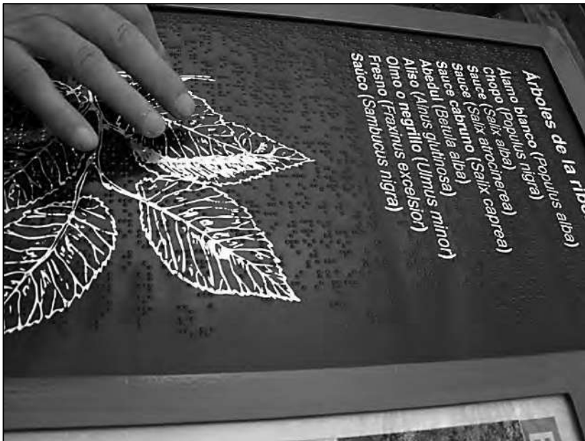
Panel interpretativo en braille dentro de un tramo adaptado de senderismo.

compartimos así una jornada por unos senderos entre tupidos bosques y estrepitosos ríos que formaban cascadas increíbles. Lo que iba a ser un recorrido a través de una ruta adaptada acabó siendo una adaptación a la ruta, donde comprobamos que las míticas barreras son solamente una leyenda si existe un verdadero empeño de que así sea. Extrayendo otra anécdota de aquella experiencia, recuerdo que la única dificultad de la ruta la encontramos en el restaurante donde comimos al finalizar ya que los baños se encontraban bajando unas angostas escaleras lo que imposibilitaba de forma evidente el acceso autónomo en silla de ruedas pero que también suponía un peligro si ayudábamos a bajar a nuestros compañeros. De inmediato los propietarios del establecimiento y la gente de la localidad tras observar una problemática de la que no habían sido conscientes hasta entonces, nos ofrecieron enseguida el aseo de otras viviendas del pueblo a los que si se podía entrar en silla de ruedas, por eso de que las barreras son un mito si existe verdadero empeño en derribarlas.