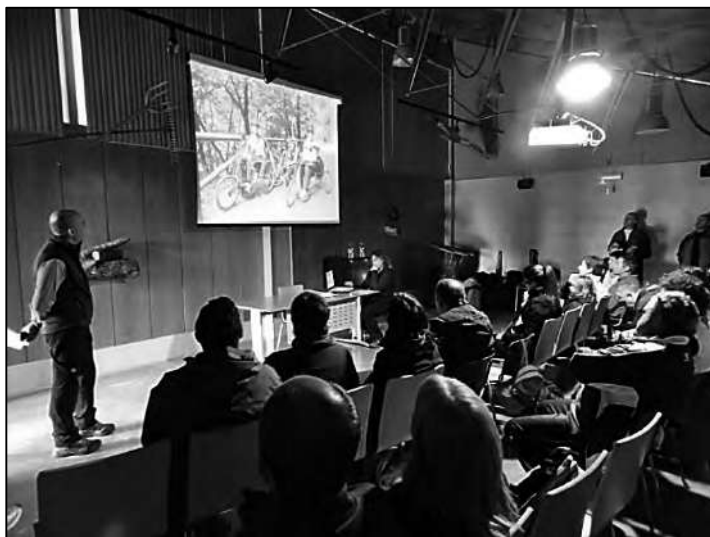
Hablando de montañismo inclusivo.

sibilidades que presentan las personas con ceguera o discapacidad visual. Mientras realizábamos el curso formativo ya estábamos pensando en subir de nivel implementando lo aprendido y en la forma de aplicar todo ello en el diseño de las actividades que programaríamos. Esos conocimientos nos habían abierto nuevas motivaciones para llevar a cabo nuevos proyectos en las montañas.