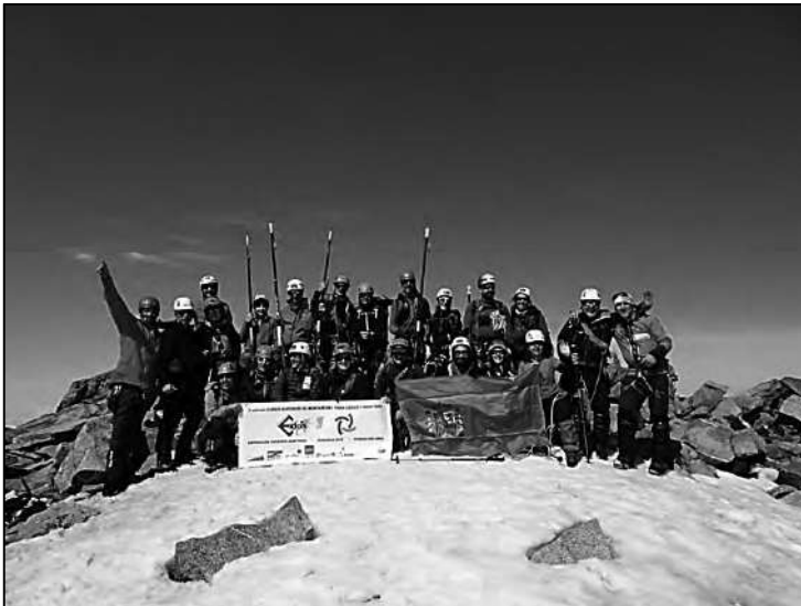
Expedición a Noruega en 2018.

Desde el año 2004, y sigo citando a Bueno, “la ONCE modificó sus objetivos con respecto al GMO en relación con sus actividades, entre otras cosas abandonando el apoyo a las expediciones internacionales...” / “Por la misma época que se suspendieron, las expediciones de la ONCE, surgieron diversos clubes y fundaciones.”