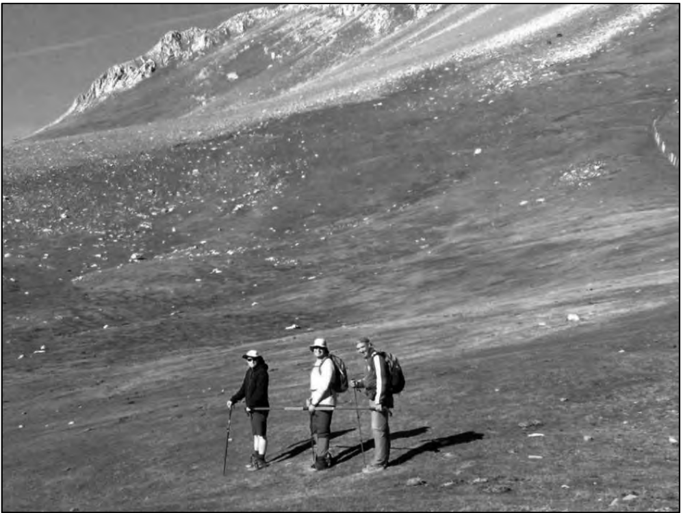
Camino de Peña Ubiña, con Lucas.

que sólo conocíamos una pequeña parte: tras una enfermedad pierde la visión y como suele suceder en casi todos estos casos, hay que volver a aprender a hacer muchas cosas para continuar con la vida a partir de ese hecho. Es preciso aprender a leer y escribir en braille, a orientarse primero dentro del propio hogar y luego en la calle, a hacer primero las actividades más elementales y posteriormente otras más complejas. Todo ello poco a poco, con mucho esfuerzo pero con el apoyo de grandes profesionales que están ahí y quizás con la aportación, casi siempre edificante, de otras personas que han pasado por esa situación y han conseguido disfrutar de una autonomía considerable tras un periodo de aprendizaje y práctica más o menos dilatado en el tiempo, con distintos condicionantes entre ellos las singularidades del tipo de afectación y la capacidad personal de aprendizaje y adaptación de cada persona a esta nueva realidad que configura este proceso de superación.