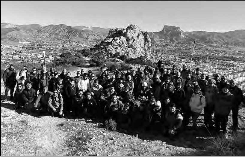
La foto simboliza el nacimiento del montañismo inclusivo en la Comunidad Valenciana.

ven, le empezó a quitar valor al intervencionismo bienintencionado, o sea, lo que la Real Academia de la Lengua Española define como altruismo.