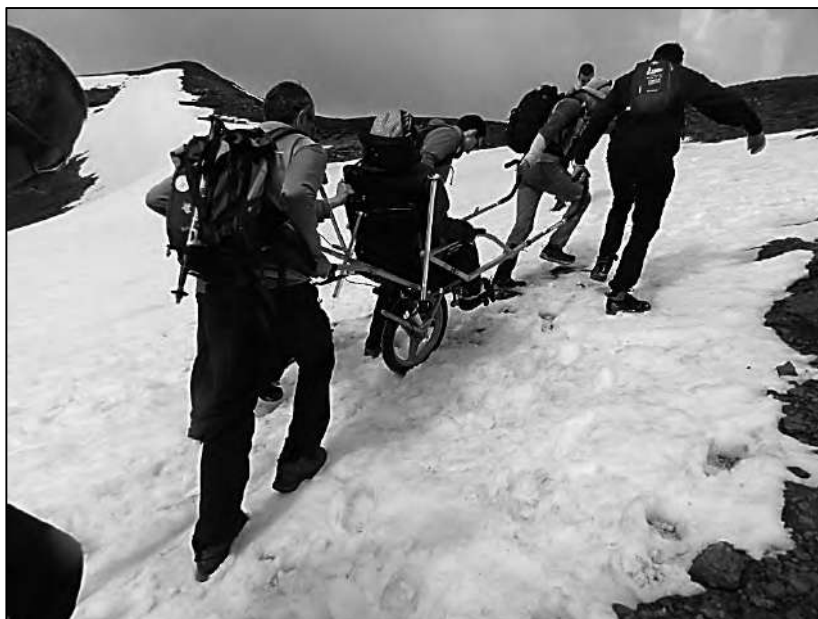
La silla joëlette subiendo al pico Valdecebollas.

endo el senderismo inclusivo mediante la realización de una actividad senderista por una grupo de personas en las que puede haber personas con una determinada discapacidad junto con otros participantes sin discapacidad.