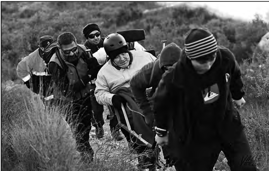
Durante la subida al monte de Bolón, en invierno.