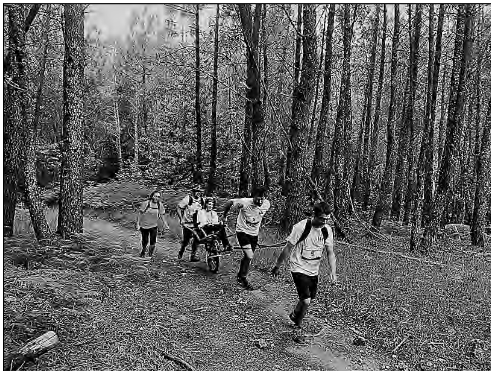
Durante una ruta inclusiva con buena temperatura.

nes en las extremidades principalmente o en otras carentes de sensibilidad, hay que considerar que aunque los guías vayan sudando en la actividad a consecuencia del ejercicio que supone mover estas sillas, no es igual para el pasajero que va inmovilizado durante la ruta, pudiendo estar padeciendo frío sin saberlo, por ello deberemos estar pendientes de la temperatura del medio en el que nos encontremos y prevenirlo mediante la adaptación de una manta o prendas de abrigo con anticipación, en caso de lluvia la colocación de un poncho que proteja de forma efectiva al pasajero impedirá además que la ropa o el asiento le generen rozaduras a que pierda calor corporal con rapidez, hecho que supondría mayores complicaciones ya que cuando este inconveniente sea detectado puede que sea más complicado de atajar, pudiendo darse casos de principios de hipotermia que han de ser solventados por distintos medios que recompongan la temperatura óptima en el pasajero, como la realización de una hoguera, realizar estimulación mediante frotamiento, o buscar el cobijo temporal de un refugio, todo ello previa valoración efectiva del estado del pasajero por parte del personal especializado.