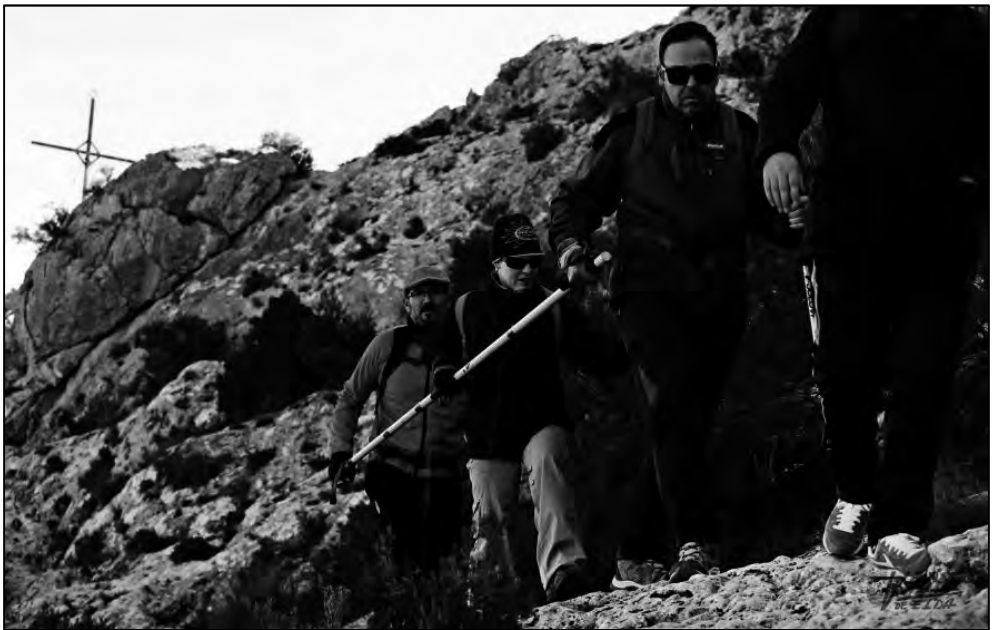
En terreno rocoso hay que extremar las precauciones.

En cuando el guía tenga lo suficientemente cerca al B1, le tenderá la mano para ayudarlo a salir de la trepada. El guía trasero siempre tiene la responsabilidad de custodiar la barra, sujetándola en posición vertical, como si de una lanza se tratase.