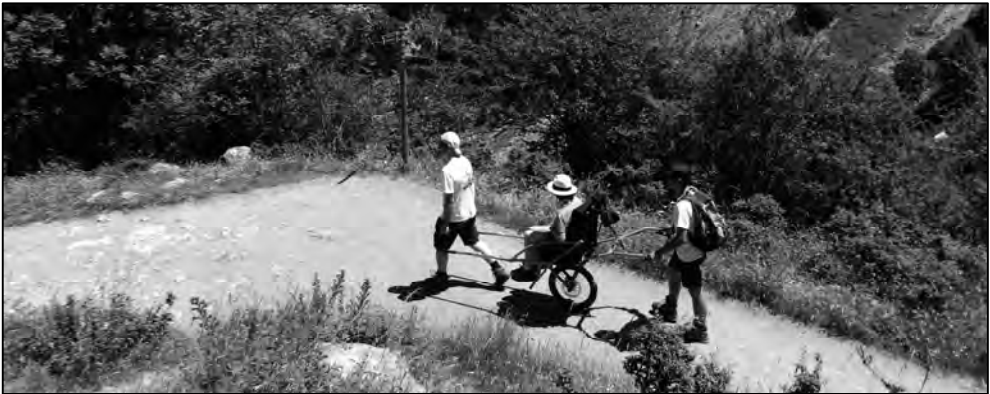
Ruta del Cares en joëlette.

La conducción en montaña de la joëlette a través de senderos ciclables no presenta mayor complicación que aportar la fuerza necesaria para afrontar las pendientes o tener la suficiente técnica en bajadas, siempre que los pilotos cuenten con algunos voluntarios que les puedan auxiliar en los lugares más complicados o con riesgo de caída. Trataremos en todo momento que el peso del conjunto de silla y pasajero recaiga de forma vertical sobre la rueda a fin de evitar inclinaciones que nos harán tener que ejercer más fuerza para contrarrestarla.