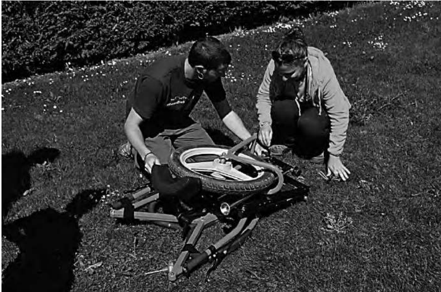
Practicando montaje y desmontaje de la joëlette.

La silla Joëlette a fin de facilitar su transporte permite el montaje y desmontaje en un espacio bastante reducido, que permite que pueda ser llevada a cualquier sitio, incluso guardada en el maletero de un vehículo compacto.