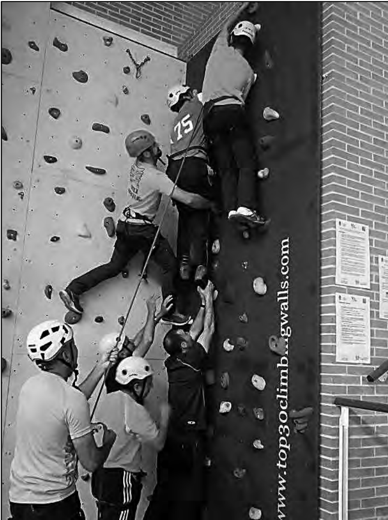
Para-escalada. Ayudando a un compañero con emiplejia a acabar la vía.