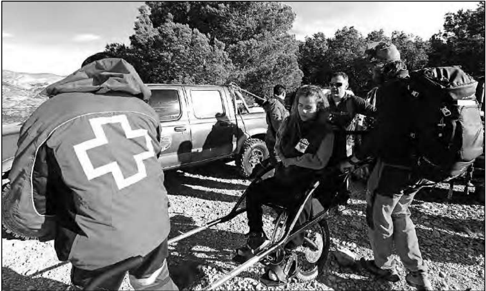
Nunca hay que olvidar botiquín y kit de reparaciones.

materia mediante la realización de cursos especializados. Nuestro botiquín básico lleva entre otros: elementos de inmovilización, vendas, productos para lavado y desinfección de heridas, colirio, analgésico en spray, pomada para quemaduras, antihistamínicos, corticoides y adrenalina para posibles reacciones ante picaduras o shock anafiláctico, calmantes y antiinflamatorios de administración oral, glucosa, apósitos y pomadas para rozaduras, hielo en gel, etc. a lo que se sumaría la medicación que fuese de necesidad de los pasajeros de la joëtte o de otras personas que lo precisen de forma específica y que vengan a la actividad, teniendo en cuenta sus pautas y rutina de utilización para administrarlos en el momento correcto. Reitero que en nuestro caso contamos con profesionales sanitarios entre el equipo de voluntarios, por tanto lo que se lleve en el botiquín hay que saberlo utilizar y en según qué casos estar autorizado para hacerlo, atendiendo a ello se configurará el botiquín con elementos de administración sencilla, eficaz e inocua, recordando que hay ciertas medicaciones a las que puede haber personas alérgicas.