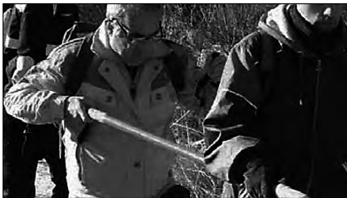
El guía de trasero, levanta la barra para facilitarle el apoyo una vez superado el escalón.

Levantar la barra y la palabra escalón alto, podrá dar indicaciones al montañero invidente de cuan alto es dicho escalón y bajarla tendrá el mismo significado durante los tramos de descenso. La maniobra la puede complementar, el guía de atrás, facilitando el paso al invidente siguiendo los movimientos de este, ya sean laterales o verticales.