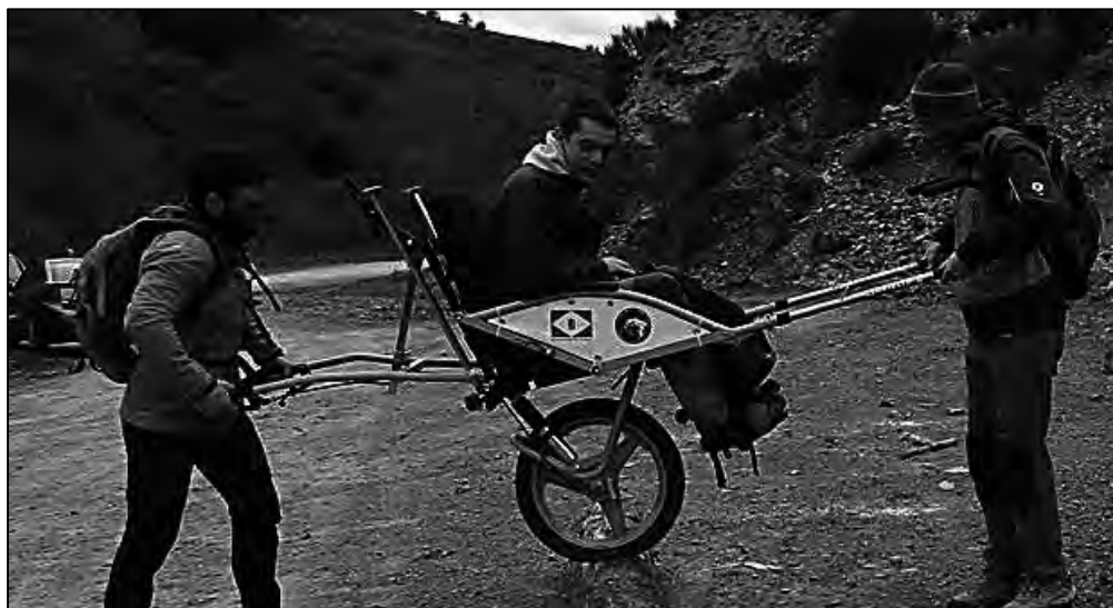
Aprendiendo a manejar la joëlette, el monitor ocupa el asiento.

pilotos en línea en la posición delantera, uno en la posición normal entre el manillar y el auxiliar en una posición más avanzada, atado a un arnés ayudando en la propulsión y el trasero en su puesto. Sobre estas posibilidades caben pocas variantes, si bien existen muchas posibilidades de que auxiliares ayuden a la tracción y estabilidad de la silla desde los laterales de la misma o mediante correas y arneses a modo de caballos de un carro por delante del guía principal de la misma.