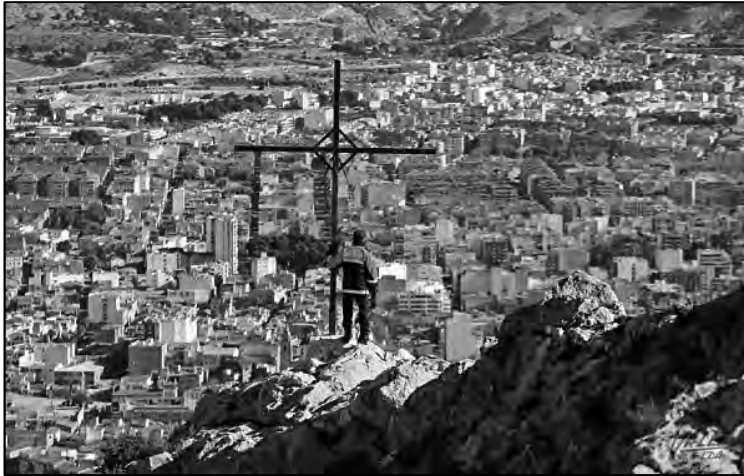
La cruz que corona la cima rocosa y domina la ciudad.

Entre sus pliegues, atesora topónimos ensoñadores, como el Peñón del Trinitario, La Patá, Peñón de Rafa, el Barranco del Capuchino y más, en un territorio para montañeros y escaladores cuya cima es bicéfala. En la más rocosa, se pierde la historia de la cruz que la remata junto a leyendas de moriscos y tesoros enterrados. La otra cúspide, más alta y suave, alcanza los 656 metros, sirviendo de base para el salto en parapente y luz candente, cual mágico sueño en la víspera de Reyes, en irrenunciable serpiente de fuego, tan original y nuestra. Bolón es “el montesico de Elda”, del recordado Rafa Hernández y el mejor mirador del Valle.