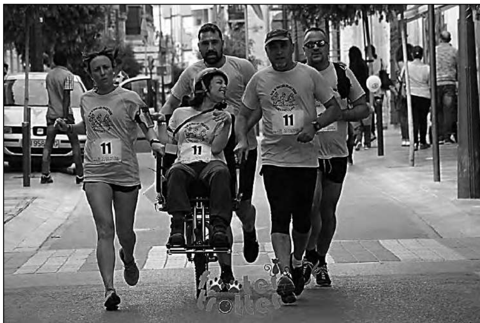
Primer Campeonato Nacional de Carreras con Joëlette, en Lorca 2018.

como decimos cada carrera cuenta con una reglamentación y hay que estar atento a lo que disponga en la que tengamos previsto participar.