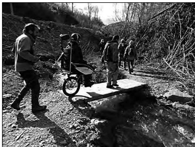
Ruta con joëlette.

Cuando comenzamos por tanto a plantearnos actividades con personas con otro tipo de discapacidad además de la visual, nos encontrábamos también diseñando las segundas jornadas de montaña y discapacidad visual que pasamos a denominar II Jornada de Montaña y Discapacidad, omitiendo el término “visual” al tomar conciencia de lo confinado del término dentro del conjunto de personas con discapacidad, en un sentido más amplio, que también podían disfrutar de los deportes de montaña.