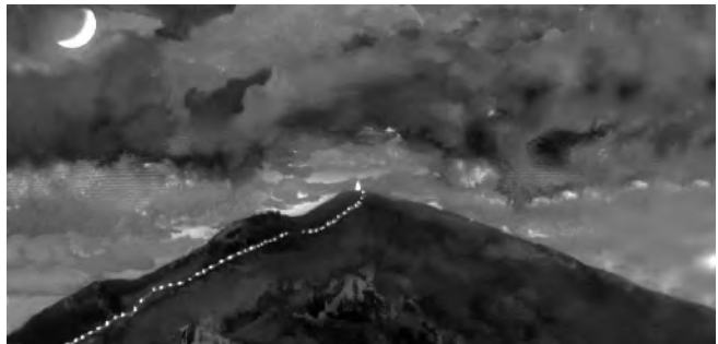
Dibujo de Florentino Caballero que ilustra una doble página del cuento.

Seguramente, con independencia de la importancia que en otras épocas pueda haber tenido, la mayor peculiaridad de esta montaña, vigía perenne del Valle, se la dimos los montañeros allá por la década de los sesenta, del pasado siglo, al encender en su más alta cima una hoguera en la víspera del día de Reyes. Aquel primer año los habitantes del Valle vieron bajar con antorchas a un pequeño grupo de excursionistas, y comenzó a correrse la voz de padres a hijos y también entre los más pequeños, que aquellas antorchas eran la comitiva de sus majestades Melchor, Gaspar y Baltasar que llegaban desde oriente por las mon-