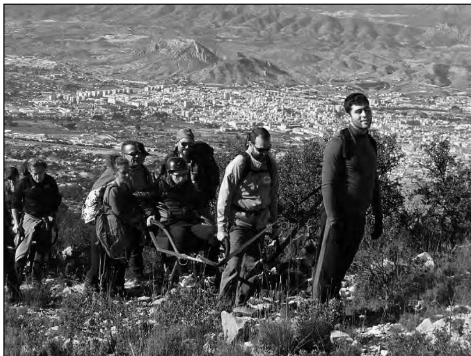
Durante el Curso de formación en la Silla del Cid.

En la actualidad muchos de los fundadores de clubes o asociaciones que realizan importantes actividades inclusivas en nuestro país se han formado a través de este programa formativo que había sido impulsado de forma pionera por una federación de montaña. Siguiendo esa estela ya son más federaciones regionales de montaña las que cuentan con un área en la que desarrollar el montañismo inclusivo, pero podemos considerar que esta faceta se encuentra aún en un estado incipiente y que continúa avanzando lentamente hacia la normalización, por lo que queremos animar a todos los montañeros a incluir estas modalidades en todas las federaciones y a promover su realización a través de programas formación y divulgación de lo que supone el montañismo inclusivo por parte clubes y federaciones por los enormes beneficios que su práctica supone tanto en las personas con discapacidad como para el conjunto del colectivo montañero que se vería así enormemente enriquecido en cuanto a lo que aportan las actividades inclusivas al con-