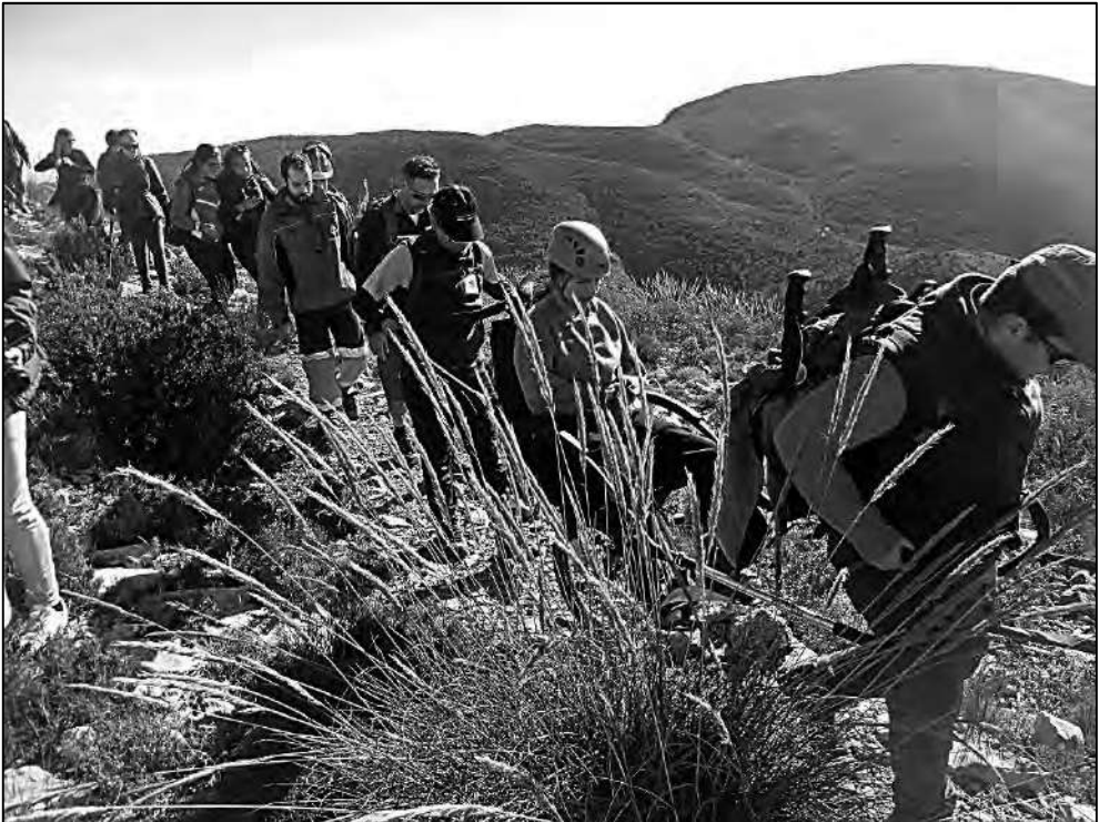
Subiendo a la Silla del Cid

dad, como la tonicidad muscular, las zonas sin sensibilidad, necesidad de medicación, si existe o no otro tipo de discapacidad adicional de tipo intelectual o sensorial que pueda ser relevante, etc. Esta comunicación si no se puede llevar a cabo directamente con el pasajero se realizará a través de sus acompañantes de confianza o familiares, para prever situaciones que se podrían presentar durante la ruta, pudiendo ser aconsejable en muchos casos contar con la presencia durante la ruta de sus cuidadores habituales, en función de la autonomía con la que cuente nuestro pasajero. También es aconsejable contar en la ruta con voluntarios sanitarios que pudieran auxiliar en casos de crisis de tipo médico o emocional, en esto cada persona es un mundo, por ello el conocimiento y la confianza del pasajero en los guías ha de ser obtenida con anterioridad a la ruta, pudiendo ser favorable en algunos casos y antes de realizar por primera vez una actividad de montaña con la joëlette, que se realice una pequeña excursión con la silla en un entorno familiar para el pasajero, como un parque previamente conocido u otro espacio controlado, para que se vaya obteniendo una confianza mutua.