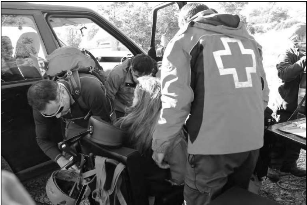
El traslado del pasajero ha de hacerse con mucha atención.

ser muy débiles y podrían dar origen a una lesión. En los cursos formativos se practican estas técnicas y debemos seguir las indicaciones que nos den el pasajero o sus cuidadores antes de proceder a la transferencia para que esta maniobra sea lo más sencilla y menos lesiva posible. La joëtte permite desmontar total o parcialmente alguno de sus brazos para facilitar esta transferencia. Una vez situado el pasajero en la silla procederemos a la colocación del cinturón de seguridad o de los arneses de tronco, o también la colocación de la cabeza en el cabezal del que dispone la silla, prescindiendo de alguno de estos elementos (nunca del cinturón básico de seguridad) en caso de que tuviera la suficiente tonicidad muscular aconsejable.