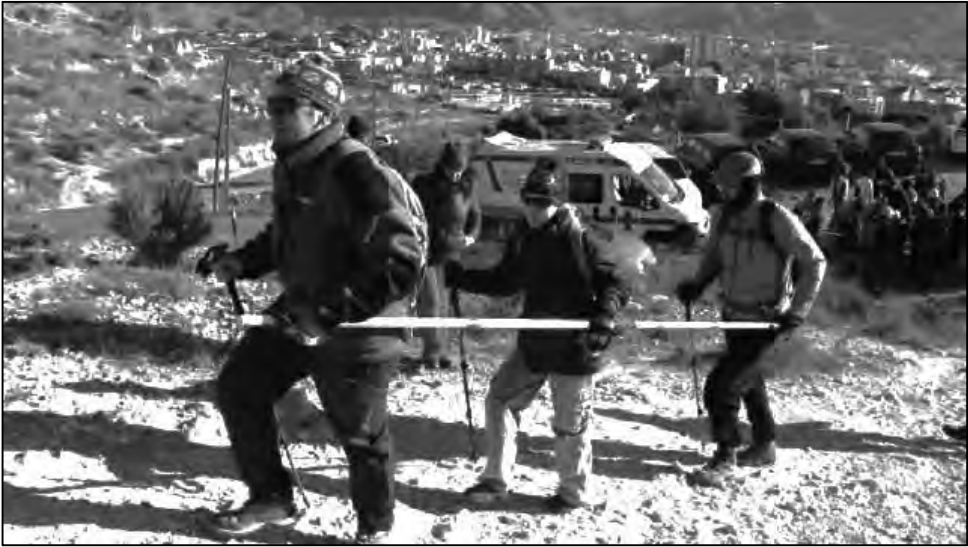
En términos generales, todos deben procurar llevar pegada la barra al cuerpo.

Si no se tiene experiencia en la conducción con la barra direccional y sobre todo si los componentes de dicha barra no tienen costumbre de salir juntos –algo que es importante para adquirir hábitos de actuación, comunicación, etc. – conviene ponerse de acuerdo, de manera especial, en las voces con las que, tanto el guía como el último, han de establecer y ponerse de acuerdo.