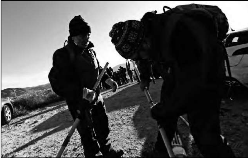
Montando la barra direccional

Para su transporte, las barras modernas se desmontan en tres tramos, lo cual facilita el poder llevarla en el maletero de un coche, e incluso portarlas en la mochila, cuando no sean necesarias.