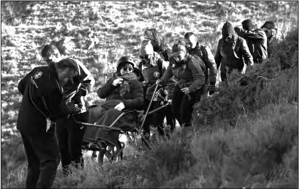
Subiendo a Bolón

En el noroeste de nuestro país la utilización de la joëlette tuvo un comienzo definido tras la realización de las Jornadas de Montaña y Discapacidad que se realizaron en la localidad leonesa de Sabero en mayo de 2013 y que fueron organizadas por el Club de Montaña Pandetrave y la Federación de Montaña de Castilla y León y donde dentro de un extenso programa se contaba con una sesión formativa destinada a conocer y practicar técnicas de conducción de joëlette, que en años sucesivos tendría continuidad formativa a través de los cursos impartidos por la Federación de Deportes de Montaña Escalada y Senderismo de Castilla y León y por el club de montaña leonés Pandetrave. Por tanto esa federación de montaña fue pionera en la integración del montañismo inclusivo dentro de la estructura federativa y los clubes de montaña, adoptando el modelo normalizador planteado por Pandetrave, a través del que se entiende que una federación de montaña debe estar preparada para atender a cualquier persona que se dirija tanto a ella o a un club adscrito, para solicitar la práctica de los deportes de montaña, independientemente de que tenga o no una discapacidad.