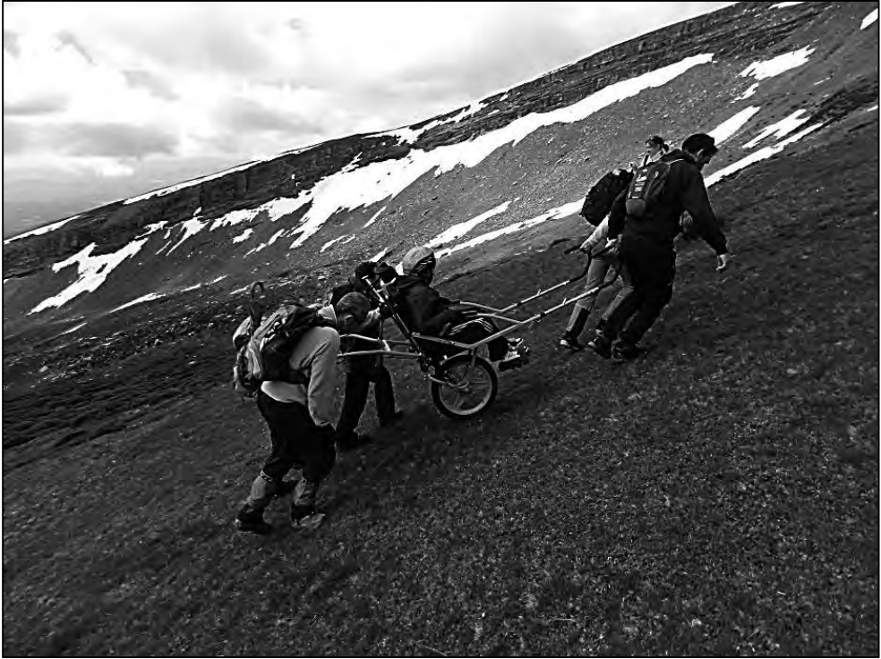
Subiendo al pico Valdecebollas. En la montaña palentina.

tenido una mayor experiencia en su guiado. Como en el caso del guiado con barra direccional, cuantas más horas de conducción realice el mismo equipo de guías, más sencilla y eficaz será la comunicación entre ellos, ahorrando tiempo en las distintas maniobras ganando en eficiencia, por eso lo idóneo es que tanto el pasajero como el resto de miembros del equipo sean los mismos si eso fuese posible, en caso de que no sea así hemos de tratar que al menos dos de los guías sí que hayan guiado juntos en otras ocasiones y cuenten con experiencia suficiente.