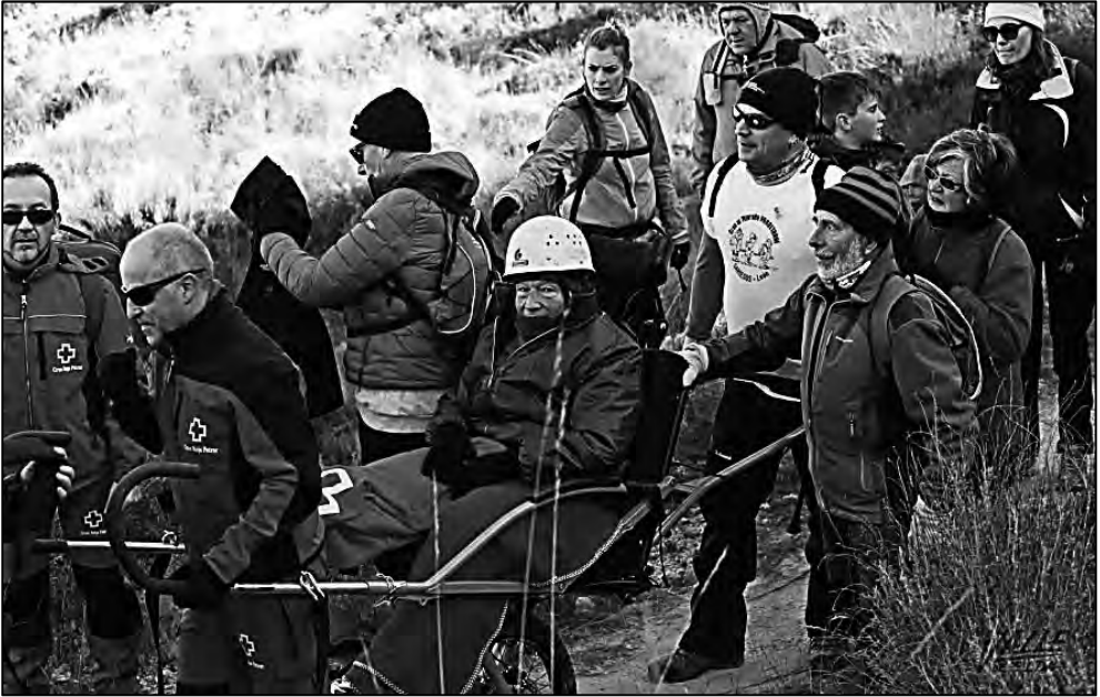
El grupo de voluntarios durante la subida al monte Bolón. Diciembre 2017.

La función fundamental del piloto trasero es atender a las demandas del piloto delantero en cuanto a la administración del freno y llevar la rueda de la silla por donde este elija, secundando las paradas que sean necesarias.