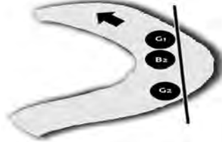
Esquema del trazado de una curva cerrada.

Especialmente cuando las curvas son muy cerradas es el momento en el que ambos guías deben estar coordinados. Veamos, paso a paso, cómo hacerlo: