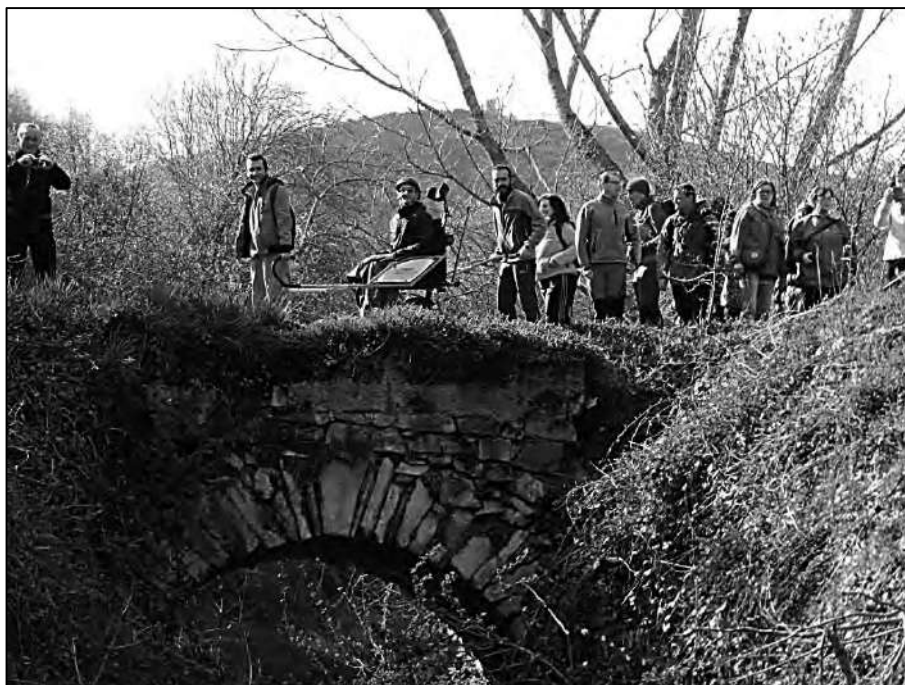
Una ruta con joëlette por montaña requerirá algunos voluntarios extra para los terrenos complicados.

Se nota cuando un equipo está configurado por un equipo de guías experimentados y sobre todo que han guiado juntos en muchas ocasiones. En esos casos la comunicación entre ambos pilotos es mucho más rápida y fluida y toma importancia a la hora de afrontar obstáculos y dificultades, avanzando en zonas verdaderamente complicadas con una rapidez sorprendente.