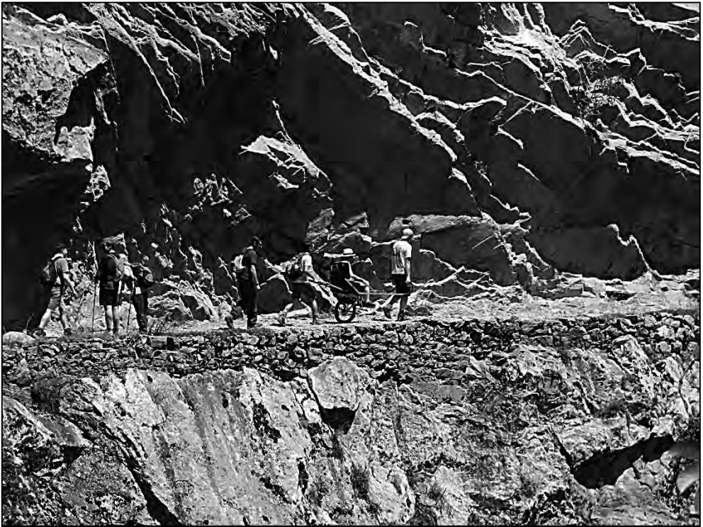
Por la Ruta del Cares en Picos de Europa.

Conduciendo la silla por terrenos de montaña prestaremos especial atención a piedras y raíces con las que las zonas bajas de la silla podrían colisionar, sobre todo el reposapiés y el conjunto de frenado. Un golpe o rozadura en los pies del pasajero puede tener consecuencias graves en caso que presente insensibilidad en miembros inferiores.