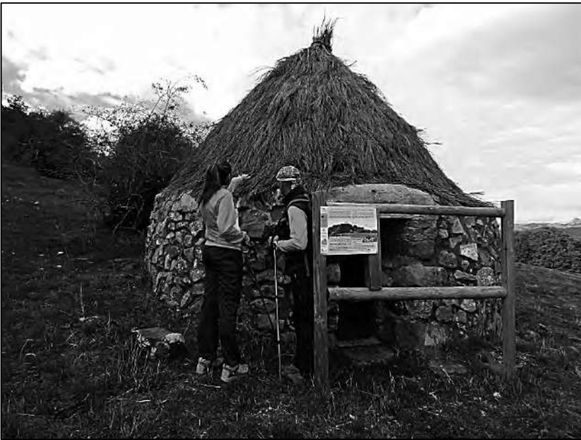
Explicando el entorno.

montaña que eran los que siempre le habían apasionado, para lo que se puso en contacto con la ONCE, institución de referencia en materia de discapacidad visual y donde le introdujeron a la utilización del método de la barra direccional, del que hablaremos de forma más extensa posteriormente, pero la opción de salir con algún grupo a la montaña se la proporcionaban únicamente en Madrid, a través de un colectivo con monitores del que disponían en una sección de montaña dependiente de esa organización, no se entendía que viviendo en León y teniendo las montañas a media hora de casa no hubiese nadie que pudiese guiar a personas con discapacidad visual en toda la provincia y hubiese que trasladarse a Madrid para hacer una ruta de montaña.