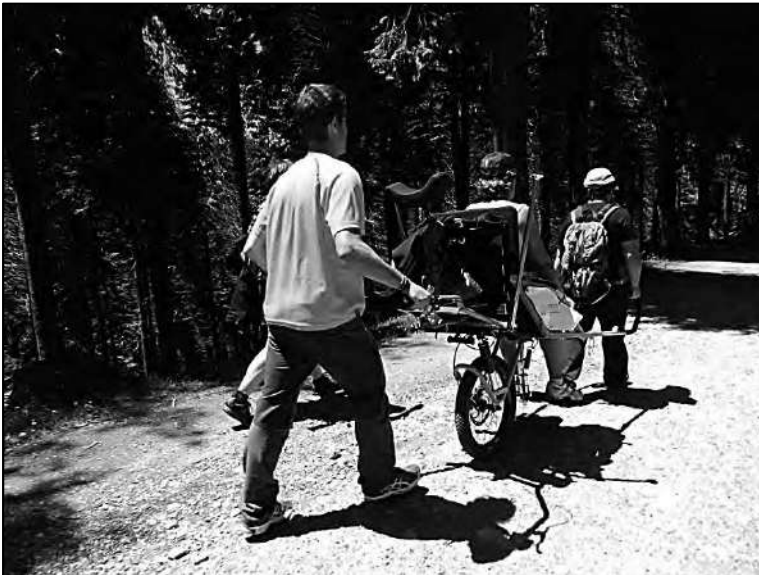
Ruta con joëlette.