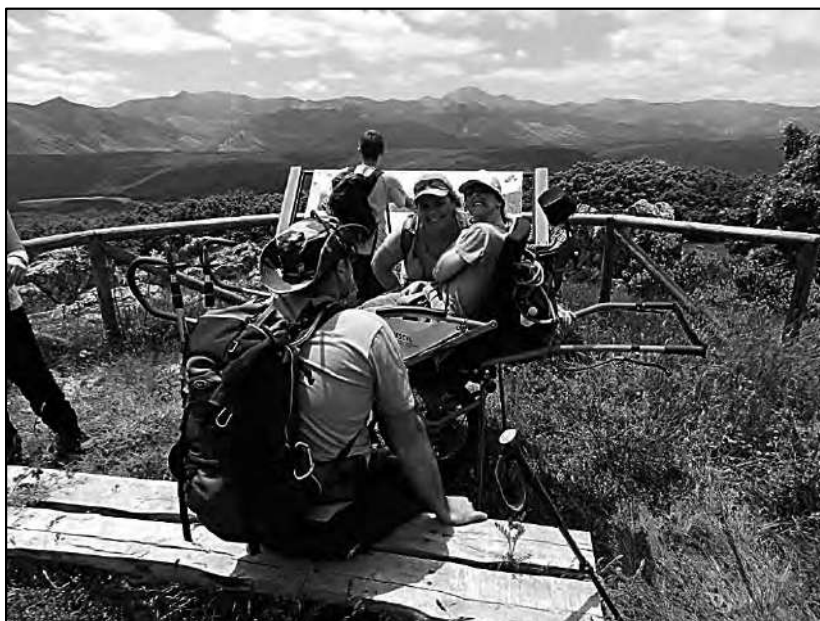
Momentos de descanso con la joëlette para reír y disfrutar del paisaje.

Nuestra primera actividad junto con personas con discapacidad física fue en el año 2010 en la vía verde La Senda del Oso, en Asturias, un itinerario que se puede hacer tanto caminando como en bicicleta y que nosotros teníamos previsto realizar en bici tándem con compañeros con discapacidad visual a los que se añadieron otros con discapacidad física con sus “hand bike” aportando mayor diversidad a nuestro grupo, en una actividad diferente a las que veníamos haciendo, actividad que nos enriqueció enormemente por aquel intercambio de experiencias y puntos de vista sobre los deportes inclusivos en la naturaleza.