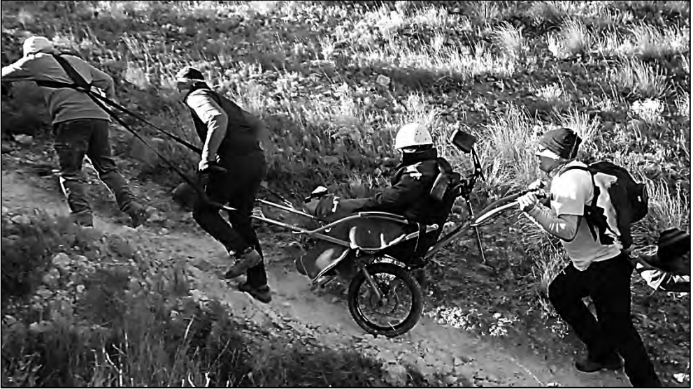
Pilotos delantero y trasero con la ayuda de un tercero y un cuarto empujando, por terreno empinado.

Otro de los aspectos principales a los que ha de atender el piloto delantero es a ejercer la tracción en el conjunto de la silla, si el terreno es ascendente en un grado de inclinación exigente, debería pedir apoyo de los guías auxiliares, bien cogiendo dos personas (cada brazo del manillar delantero una persona) en caso de que la anchura del camino lo facilite o instalando el arnés y ayudando el auxiliar en la propulsión por delante del guía principal.