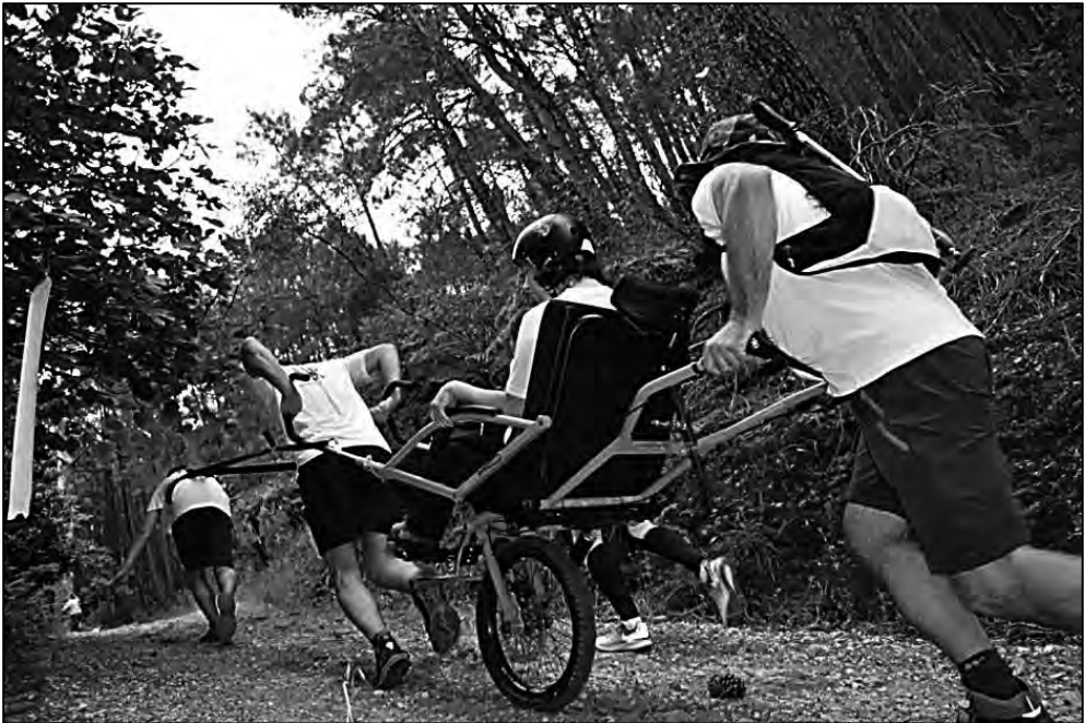
Equipo joëlette de Pandetrave durante una carrera de montaña.

una asociación constituida como de interés general y sin ánimo de lucro, con el propósito de continuar con el proyecto de Claudel, utilizando la silla que él desarrolló y con la que se realizarían actividades de senderismo en entornos naturales que pudieran ser compartidas por personas con discapacidad física y por otras sin discapacidad, uniéndose todas ellas con el fin de realizar proyectos de senderismo inclusivo, para lo que adscribieron la asociación a la Federación Francesa de Senderismo (FFS).