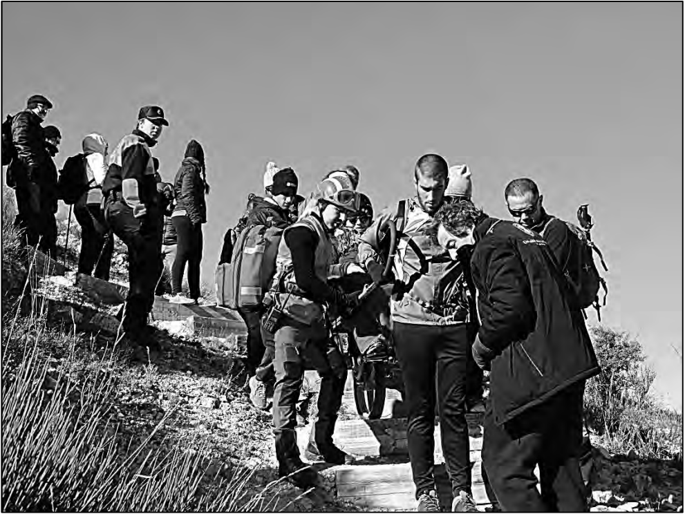
Bajando altos escalones en la pendiente. Bolón 2017

motor eléctrico de ayuda, patín para nieve, bolsa de transporte, etc. e incluso se ha desarrollado un modelo con dos ruedas paralelas bajo el asiento del pasajero y otra más pequeña ligeramente adelantada a fin de facilitar su estabilidad si su objetivo es el uso de caminos adaptados o de buen firme, que le hace ganar en envergadura perdiendo maniobrabilidad pero que puede ser utilizada con menor exigencia física y técnica por parte de sus pilotos, siempre que las características del terreno lo permitan.