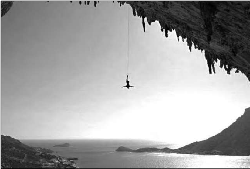
Urko, escalando en Kalymnos (Grecia).

Hemos querido reunir experiencias reales, propias y ajenas, de personas anónimas y también de grandes figuras del montañismo, la escalada y el alpinismo, extrayendo enseñanza y reflexiones de sus contactos con el mundo del Montañismo Inclusivo y esperamos que todas os parezcan lo suficientemente enriquecedoras que puedan ser estímulo para las inquietudes de muchos de los lectores de este compendio de técnicas, vivencias y expresiones que conforman esta humilde introducción al Montañismo Inclusivo.