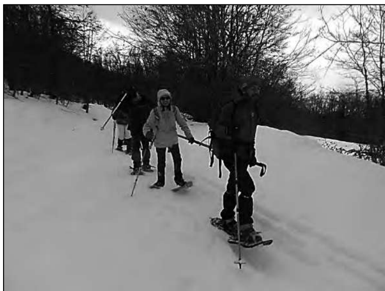
Ruta con barra direccional y raquetas de nieve.