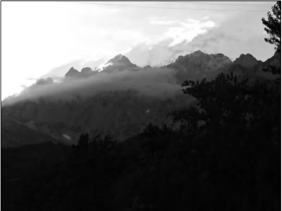
Describir el camino y el paisaje, es explicar el sentimiento que nos produce.

Entre las más comunes, ya hemos citado escalón alto o escalón bajo; de subida o de bajada e incluso subibaja, como una sucesión de escalones o piedras que hay que subir y bajar constantemente. Aprenderemos a no olvidar las direcciones, como derecha o izquierda, arriba y abajo; cambio de barra o cambio de mano.