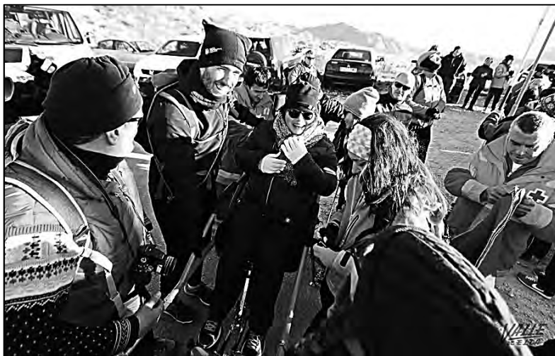
Durante los preparativos.

–Vamos a subir a gente con distintas discapacidades a Bolón – decía yo entusiasmado y equivocado, más adelante sabréis el porqué, aunque quizás ya lo intuís.