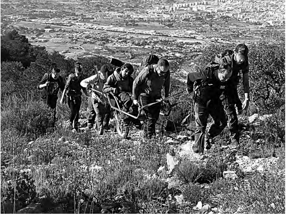
Foto portada: varios voluntarios auxiliares serán necesarios cuando existen pendientes duras en el recorrido.

colaboradores para evitar que el resbalón de un guía al descender haga que la joëlette se caiga con inciertas consecuencias.