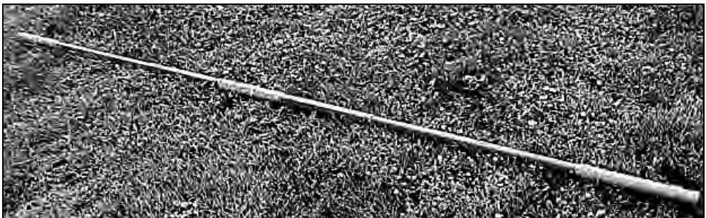
La barra direccional mide 3 metros de largo y 3 cm de diámetro.

La barra direccional se ha fijado en 3 metros de longitud por tres centímetros de diámetro, como la más idónea, especialmente para terrenos fáciles de baja montaña y también se ha optado en otras medidas más cortas para terrenos de mayor dificultad o bien sendas con continuo viraje, siempre teniendo en cuenta que una barra excesivamente corta como por ejemplo de 2,5 metros, puede causar problemas de pisotones entre los componentes de dicha barra, si se trata de personas especialmente altas y de gran zancada pues puede propinarse algún pisotón al que va delante; es especialmente peligroso si se camina por terreno nevado con crampones, donde el daño puede ser mayor. En definitiva, la longitud de las barras que hasta ahora se han usado para la montaña, han sido de entre 2,5 y 3 metros de longitud por 3 cm. de diámetro. Suelen llevar unas empuñaduras para poder asirlas con mayor comodidad y una dragonera que evitara que se nos pueda caer de la mano.