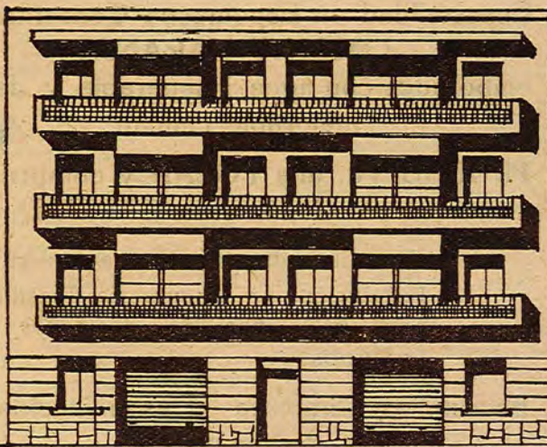
Calle General Yagüe

Suscripción Trimestral, 25; Semestral, 50; Anual, 100 Depósito legal A.-N.º 9 - 1958