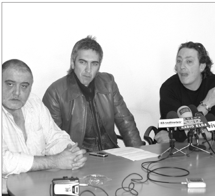
Los representantes de los comerciantes denuncian la ambigüedad del PP