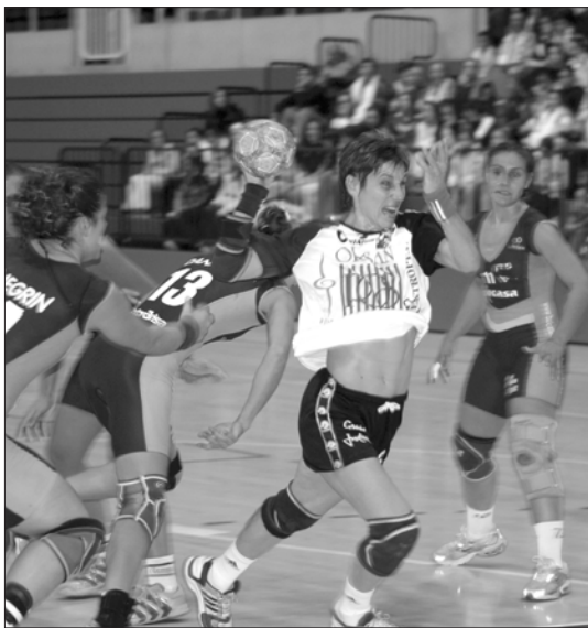
Diana se empleó a fondo contra las canarias

En el partido de inicio de la Copa de Europa de este año, disputado en Noruga, el equipo eldense consiguió ante el Tertnes Bergen por 25 a 33 su primera victoria como visitante en toda su participación europea en esta competición. Este sábado a partir de las 4,30 horas, reciben al equipo de Serbia y Montenegro, Din-Nis.