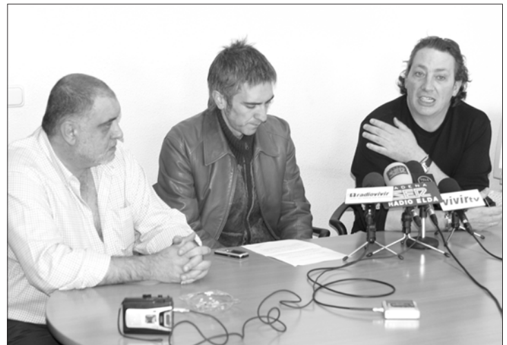
Representantes de la Asociación de Comerciantes de la Gran Avenida