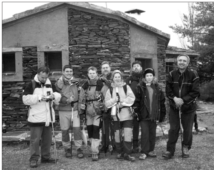
Algunos montaÑeros del CEE que ascendieron al Cerro Pelado (3.182 mts.) el pasado 31 de enero

Para el sábado 28, el Grupo de Montaña los Caracoles del Vinalopó nos han preparando un recorrido entre Bocairente y Alfara por la Sierra de Mariola. El programa será el siguiente: A las 7 h. salida del autobús (inscripciones a mi teléfono 606 273 956) desde Churrería Domingo, en la calle Santa Bárbara; sobre las 8h salida de la marcha desde la estación abandonada de Bocairente, seguiremos por la Ermita de San Jaime, Ermita de Santa Bárbara y al-