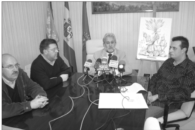
Presentación del boceto de la falla

Según comentó el edil de Fiestas, Alfredo García, la continuidad de esta Falla Oficial, dependerá en gran medida de la aceptación que se tenga por parte de los vecinos y festeros.