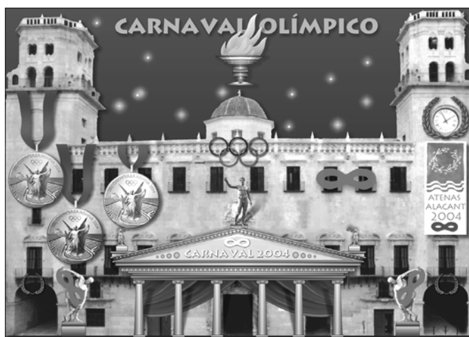
Boceto ganador del concurso