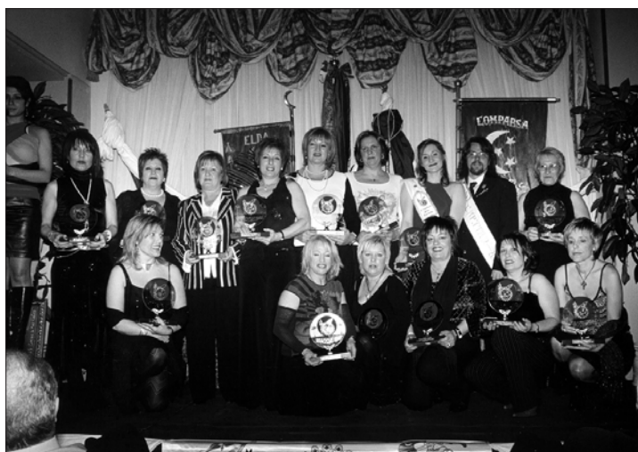
La escuadra «Marezun» recibió el premio a la mejor de las fiestas 2003

Las escuadras realistas premiadas en las fiestas de 2003 recibieron los trofeos de la comparsa: «Saudí Negros», la femenina «Marezun» que cumple 25 años y «Los Peques», en la