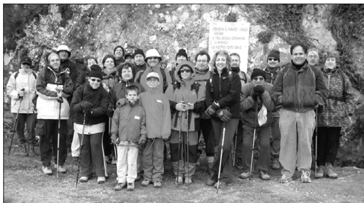
En la fuente del Pouet (1300 mts), al pie de la cima de Montcabrer, el pasado 18 de abril.