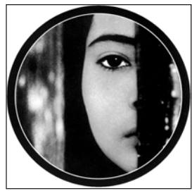
Viernes, 19 «Baran»