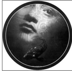
Miércoles, 17 «Whale Rider»