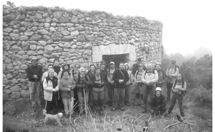
Cava de Simarro, Font Roja, 07-11-04