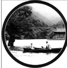
Lunes, 15 «Primavera, verano, otoño, invierno... y primavera»