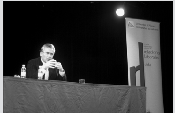
El juez Garzón durante su conferencia en Elda

El juez Baltasar Garzón ofreció una conferencia el 4 de noviembre en la Casa de Cultura sobre terrorismo internacional y nacional. El público abarrotó el salón de actos y resto de instalaciones del edificio, ya que se instaló una pantalla gigante para hacer llegar sus palabras a la multitud.