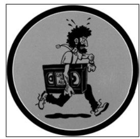
Jueves, 25 y viernes, 26 «5ª edición Cortos de aquí»

La concejalía de Cultura traslada su XIII Semana de Cine «Elda de estreno» al teatro Castelar. Este cambio representa, en opinión del edil de área, Carlos Ortuño, la posibilidad de ofrecer proyecciones con mejor sonido e imagen. La muestra se complementa con sesiones de cine que comenzaron el pasado fin de semana, así como con el concierto de Mastretta «La Factoría del ritmo», y continúan este fin de semana con la exhibición de cinco películas: día 13, «El juego de la verdad», pases a las 19 y 22