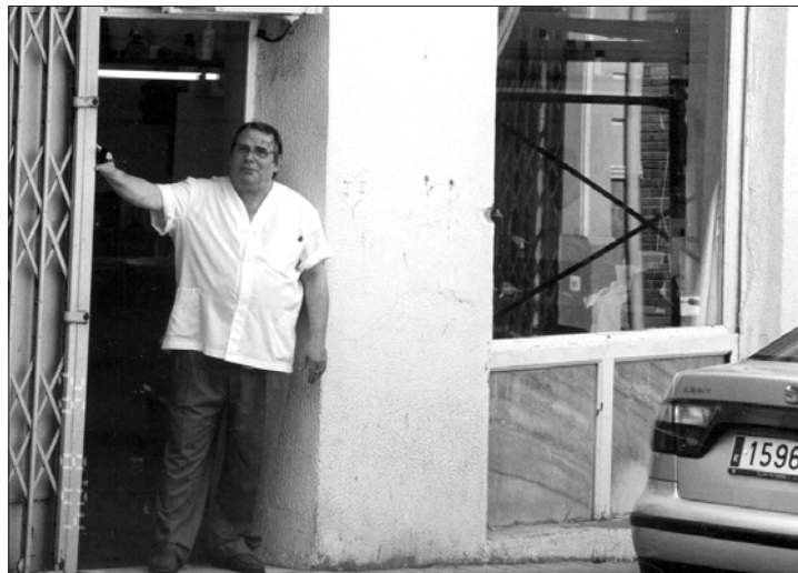
Fachada de la barbería