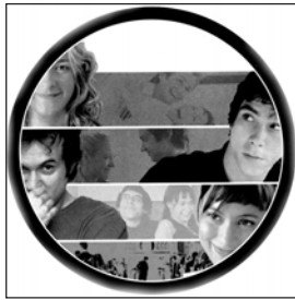
Sábado, 13 «El juego de la verdad»