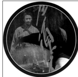
Jueves, 18 «Zatoichi»