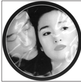
Martes, 16 «El tren de Zhou Yu»