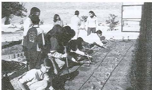
Alumnos del Instituto de E.S. "Valle de Elda", trabajando en el "Aula de la Naturaleza" creando en el patio del Centro.

Dos proyectos educativos relacionados con el medio ambiente, realizados por profesores del I.E.S. Valle de Elda, han sido seleccionados y premiados por el "Programa Criterio" que la Caja de Ahorros del mediterráneo organiza para estimular el trabajo, la creatividad y la investigación en los centros educativos. Los proyectos son: