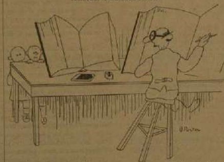
«Oye, maestro, como a las apañas para meterse esos libros tan grandes! Para se muy fácil, en los libros poco un tendedor!»