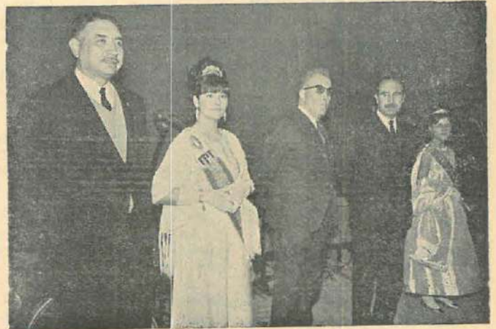
Autoridades que efectuaron la imposición de bandas a las bellezas falleras, damas de honor de la Reina y falleras infantiles, en el festival del pasado sábado.