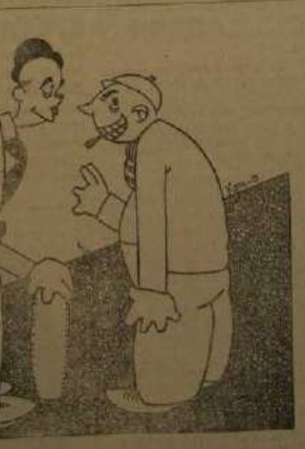
- En resumen: que desde que digo, no dice digo... - Si la cuestión es el terreno para... - Otros venían que llevaban los barcos...

El domingo pasado volé un avión de Alicante número 1291, en las inmediaciones de nuestra población cerca de Villa Manolito. El coche sufrió algunos desperfectos, y los ocupantes resultaron flexos por fortuna.