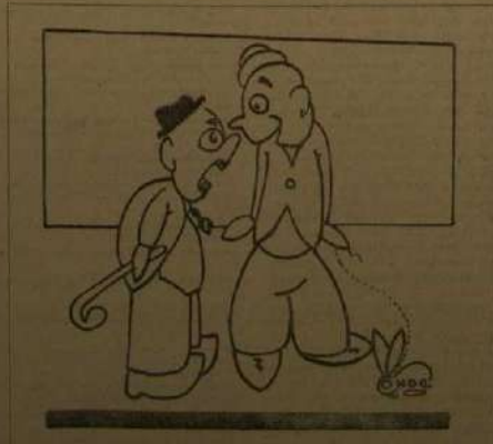
«No pongas que eres de pasados. Lo acordado no tiene importancia ninguna y es de una naturaleza del mundo.» —Barral (Hablar, a su vez) «Claro que el hombre. Todo lo que se puede, al fin siempre se consigue.»

IDELLA se honra con la colaboración honoraria de RAFAEL ACIBARRA, JOSÉ MARTINEZ RUIZ («ARCIBO»), GABRIEL MICO y MARCELINO DOMESTICO. Cuenta también con la colaboración artística del genial caricaturista LUIS BARRAL.