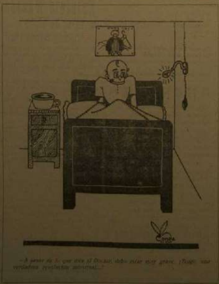
—A pesar de lo que dice el título, debe estar muy grande. (Basta una vez para verla, ¡no se repite!)

Los campos están profusamente iluminados, y el balón se pinta de un tono plateado brillantemente.