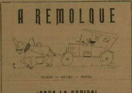
Humor — Sátira — Ironía

Funeraria del Santísimo Cristo del Buen Suceso