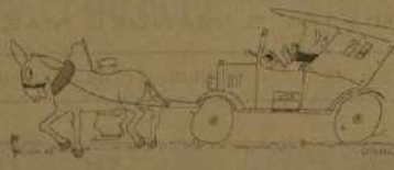
HUMOR — SATIRA — IRONIA