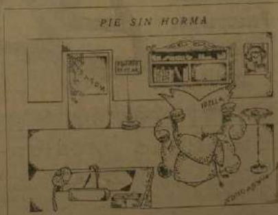
ES QUE LER. — En un chisme de IDELLA se habla de un... Propaganda ideas democráticas... (hab, hab, hab) Con lo mandamos que se vayan con los anticuarios... (hab, hab, hab) Ya lo dijo el último... (hab, hab, hab) «Mira, mira, mira»... Es decir, no hay travesía sin fi