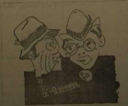
LOS MAY HEREDOS