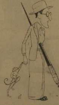
El dibujante de la «Veraguas», vive por un colón 1/25.

Así, pues, el contribuyente que no quiera pagar el primer recargo del diez por ciento, tiene de tiempo hasta el próximo lunes día 11 de corriente en estas oficinas de la Alcaldía, de la calle de Castelar en esta ciudad. Horas de oficina de 9 a 12 mañana y de 3 a 6 tarde.