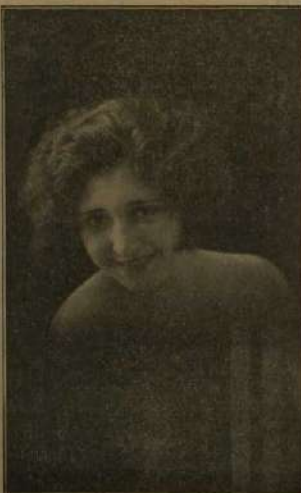
Manolita Ruiz, bella mujer, excelente actriz